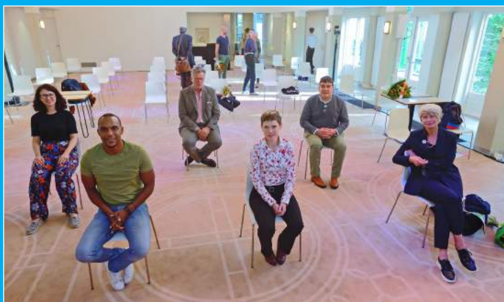
Algemene ledenvergadering 2020.