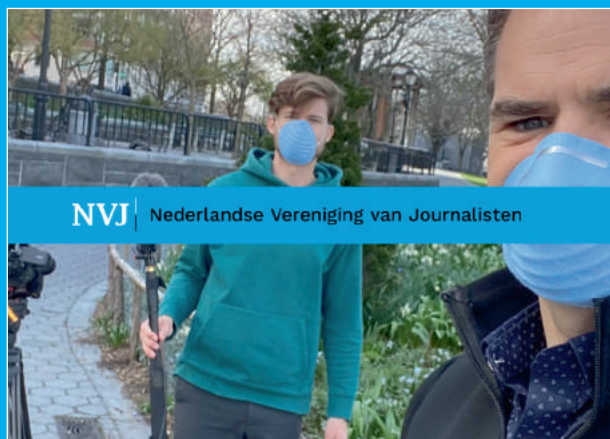
Still uit STER-commercial NVJ.