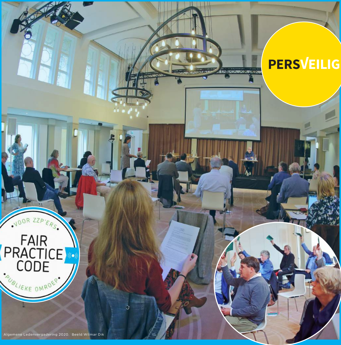
Algemene Ledenvergadering 2020.

In 2020 stapten we de geheel onbekende wereld binnen van een pandemie. De nieuwe omstandigheden hadden voor journalisten complexe gevolgen. Ook de NVJ gooide noodgedwongen het roer om. Met het vizier op slechts één doel gericht: het zoveel mogelijk bijstaan van leden. En hoewel het toekomstscenario aan het begin van het jaar er zo anders uitzag, bleef onze missie altijd gelijk: het opkomen voor de belangen van de leden.